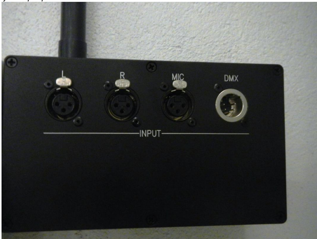
foto inrikkpunt zaal